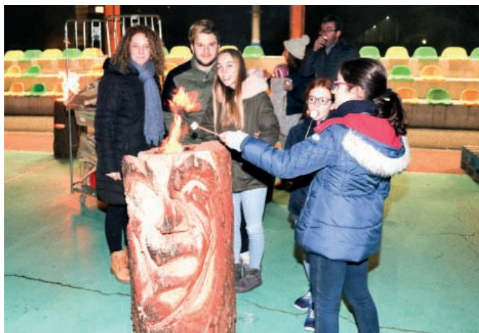
L'accensione delle torce svedesi

L'Aperitif in oratorio ha così assunto una valenza sociale in quanto consente l'incontro di persone che sempre più spesso faticano nel trovarsi serenamente a confrontarsi al di fuori