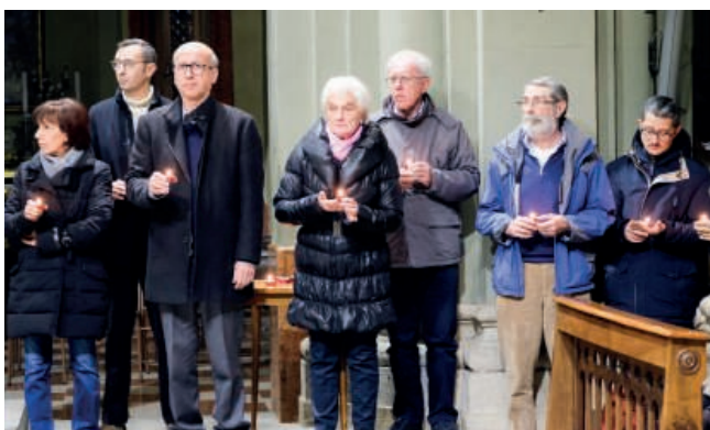
I rappresentanti di istituzioni e associazioni