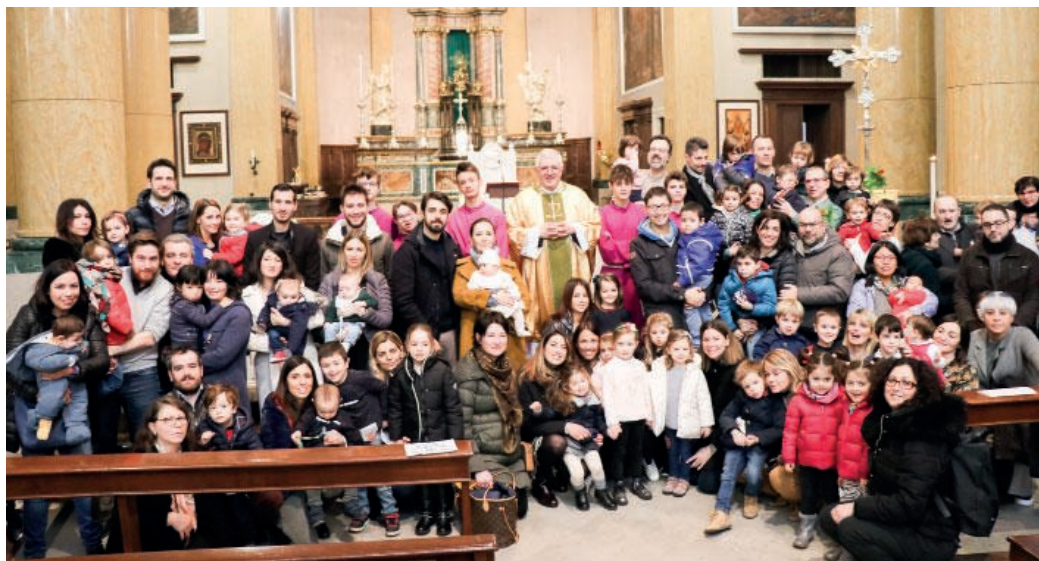
Le famiglie riunite in Basilica in occasione della giornata per la vita

tono che questa realtà continui a vivere (religiosi e laici) sono come il Padre della parabola: i figli possono anche andarsene, ma se decidono di tornare, la casa la trovano lì ed è una casa aperta ed accogliente.