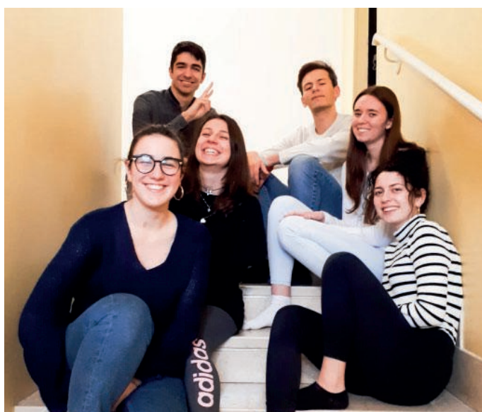
Il gruppetto dei 19enni della vita in comune

La vita comune ha avuto inizio la sera di domenica 26 gennaio. Dopo l'incontro di catechesi del gruppo 18enni a S. Ambrogio e dopo la cena insieme presso l'Aperitif organizzato all'oratorio di S. Valeria, i ragazzi si sono "trasferiti" nella casa: l'incontro introdut-