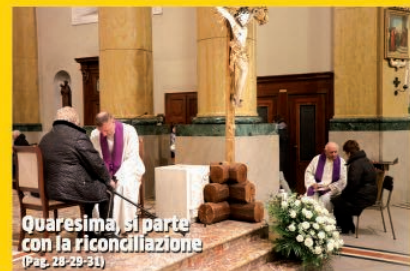
Quaresima, si parte con la riconciliazione (Pag. 28-29-31)