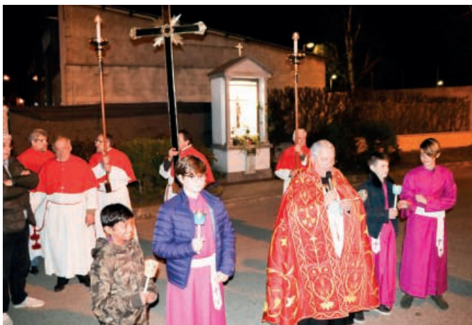
La cappellina di piazza Prealpi meta della via Crucis

Venerdì Santo 10 aprile alle 21 ritrovo al monastero delle suore Adoratrici del SS. Sacramento in via Stefano da