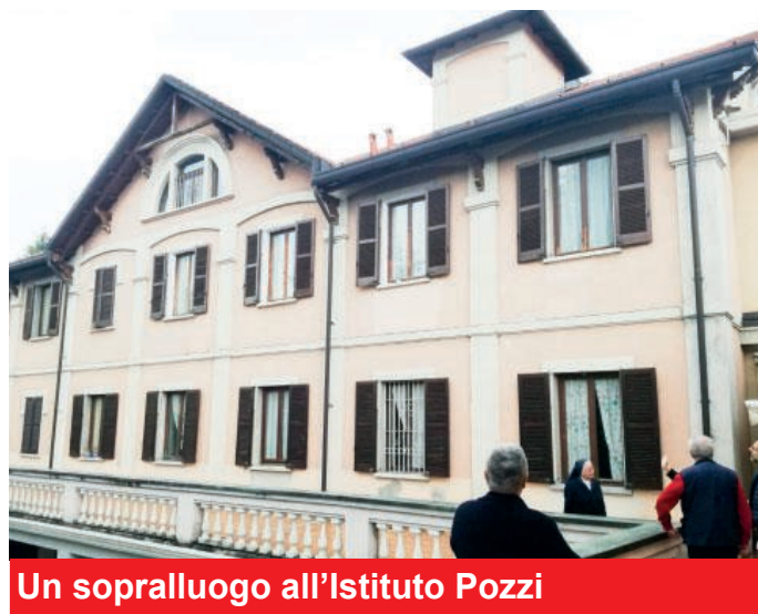
Un sopralluogo all'Istituto Pozzi

La possibilità-disponibilità è stata verificata con le supe-