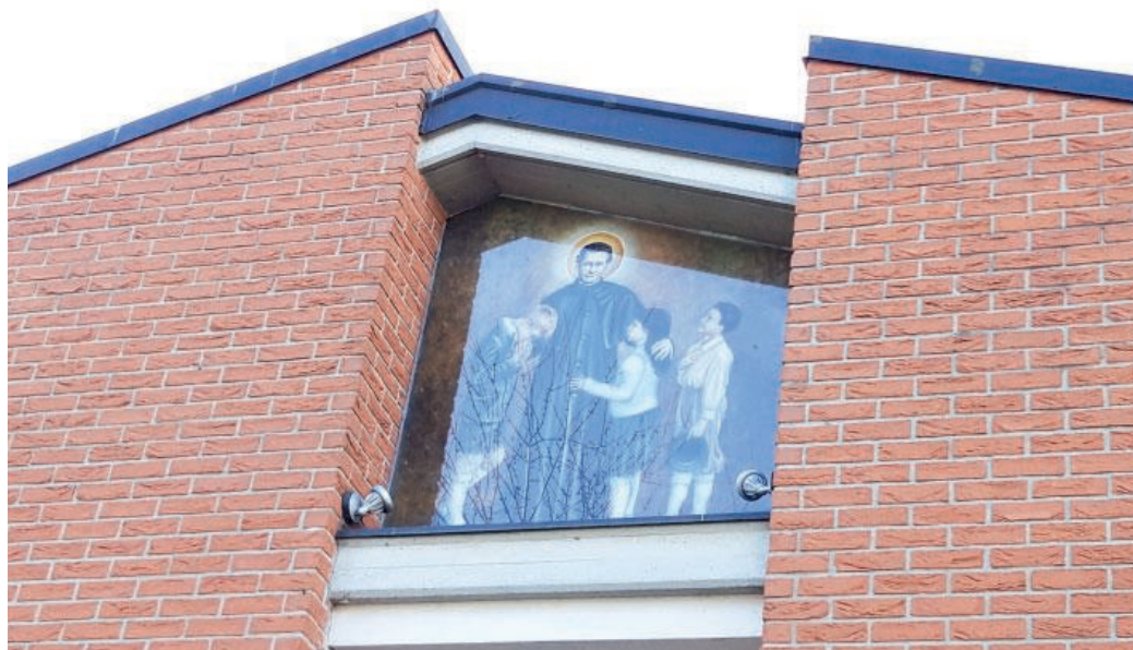
Il 'rosone' della chiesa parrocchiale dedicato a San Giovanni Bosco

Nella sua complessa vicenda, don Bosco avrebbe avuto di che lamentarsi. Quante diffi-