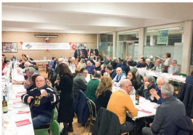
La cena della confraternita in oratorio