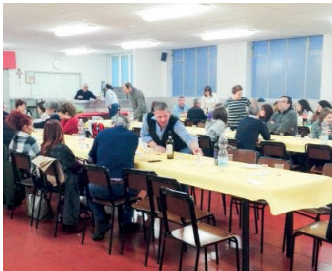
Il pranzo condiviso per la festa della famiglia

Il pranzo di condivisione prevedeva come primo piatto la classica italianissima pasta al pomodoro, preparata dai volontari della cucina e offerta dalla parrocchia, mentre per i secondi, i contorni e i dolci è venuta a galla la maestria delle famiglie che si sono occupate della loro preparazione. Ce-