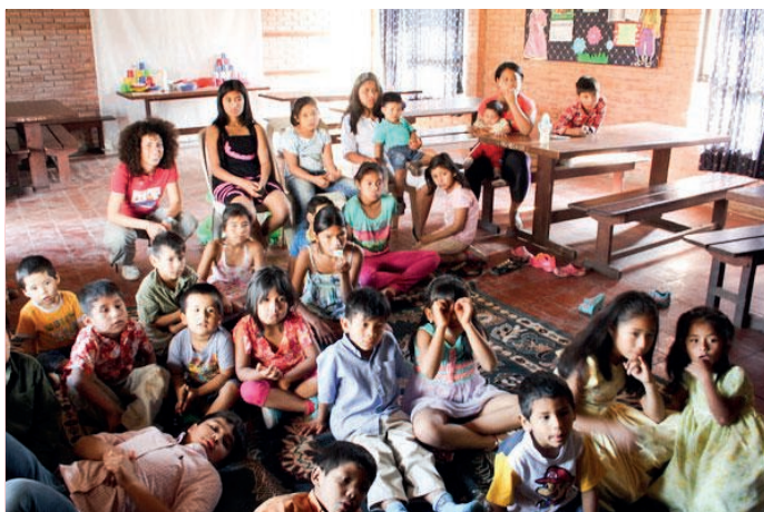
L'hogar de la Esperanza a Santa Cruz

Una proposta per le vacanze estive: un viaggio in Bolivia non solo da turisti ma tra i bimbi dell'Hogar de la Esperanza