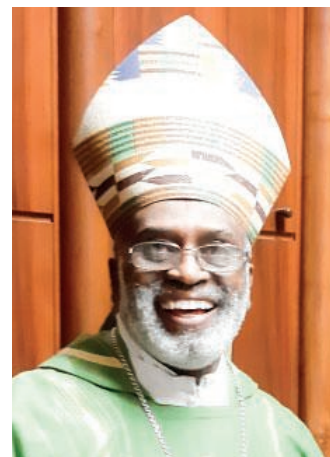
Il vescovo Buckle