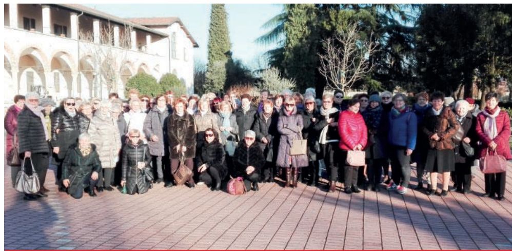
Un gruppo di partecipanti al pellegrinaggio per S. Agata