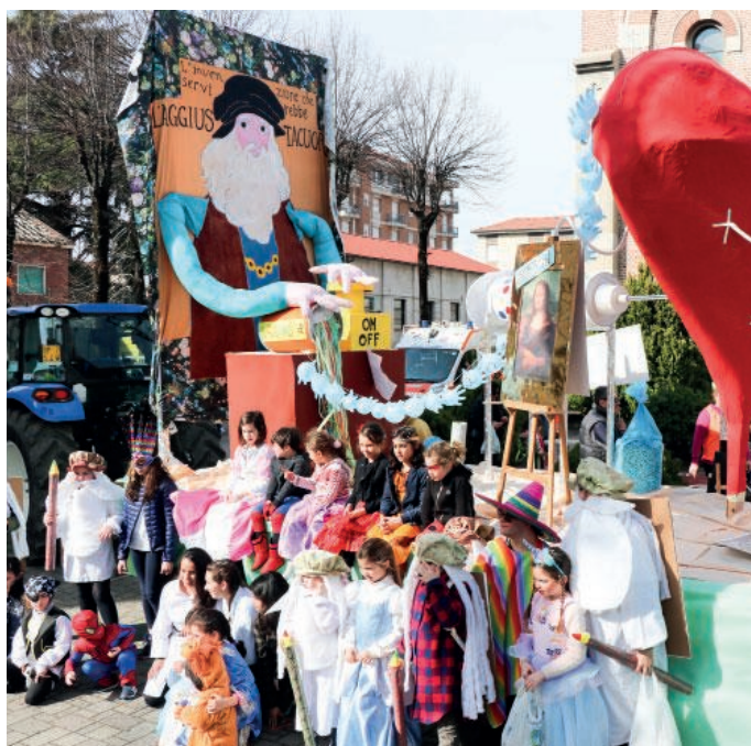
Il carnevale al San Rocco dell'anno scorso

Ma cambia anche la data storica in cui festeggiare il Carnevale. Non il tradizionale sabato grasso, che per altro quest'anno cadrebbe in una data insolita, il 29 febbraio, ma la domenica 23, allineandosi