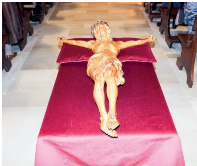
Il Crocifisso esposto in chiesa a S. Ambrogio

"L'atto di disprezzo verso il nostro crocifisso - ha detto - rimane davvero un fatto forte-