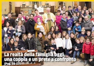
La realtà della famiglia oggi, una coppia e un prete a confronto (Pag. 16-17)