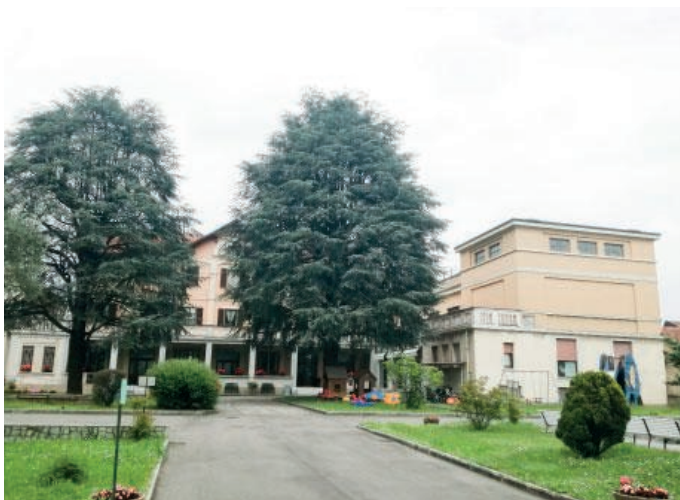
Il complesso di via Montello dell'istituto Pozzi