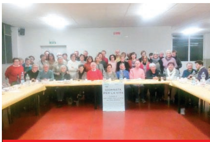
I volontari del Cav impegnati per le primule

“Nell'arco dell'anno 2019 le operatrici volontarie hanno continuato a mantenere il loro impegno per aiutare le donne ad affrontare la maternità difficile prima e dopo la nascita del bambino - prosegue la relazione - intendendo per maternità difficile anche quei fattori soggettivi, individuali, psicologici che possono indurre la madre a scegliere l'aborto. Per conseguire queste finalità, le volontarie sottolineano ancora una volta l'importanza di instaurare con le donne che si rivolgono a loro un rapporto di ascolto, di dialogo personale e di condivisione