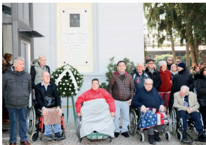
L'omaggio alla lapide ricordo di Giovanni Colli