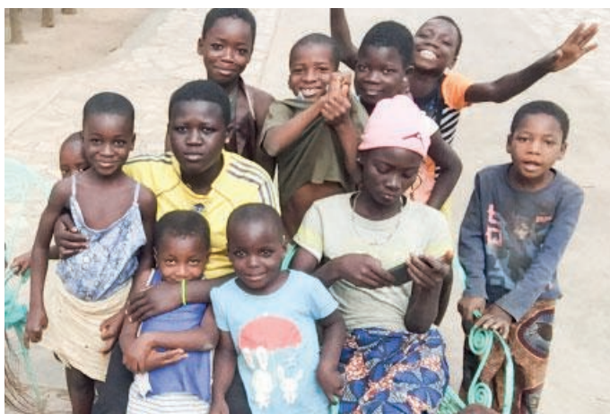
Bambini all'ospedale di Tanguiéta

Definito nei dettagli anche il progetto di riqualificazione del pronto soccorso all'ospedale di Tanguiéta nel nord Bénin, il GSA si prepara a sostenere la campagna di raccolta fondi per realizzare una struttura ormai indispensabile, data l'assoluta inadeguatezza dell'attuale struttura nel far fronte all'ingente quantità di lavoro.