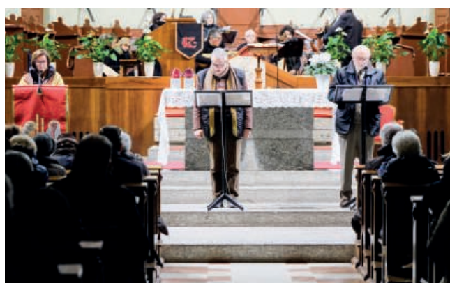
I dialoghi di pace 2020 in Abbazia

Il messaggio del papa e la lettera di Langer per i “Dialoghi di pace”