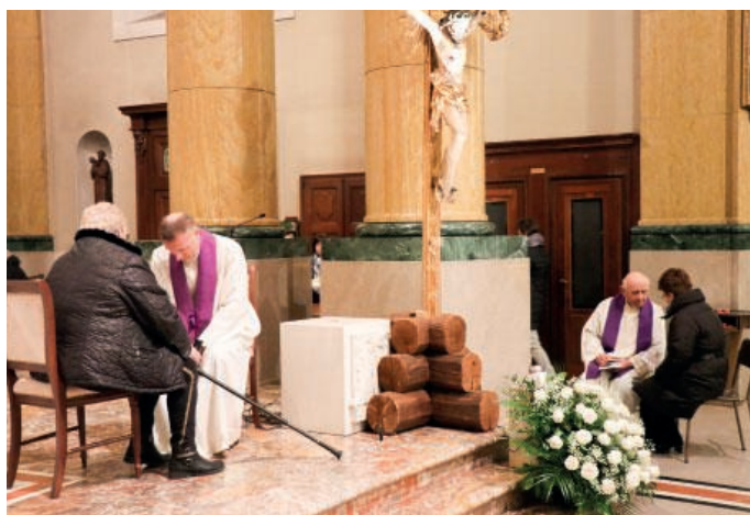
La riconciliazione comunitaria per la Quaresima

Nei primi cinque venerdì in Basilica via crucis alle 7,30 - 9 - 18; nei venerdì 6, 13, 27 marzo, 3 e 10 aprile via crucis per le vie della parrocchia.