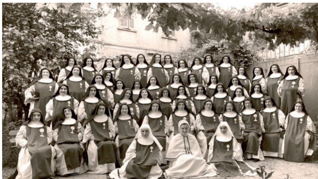
La prima foto della comunità delle Adoratrici Perpetue a Seregno