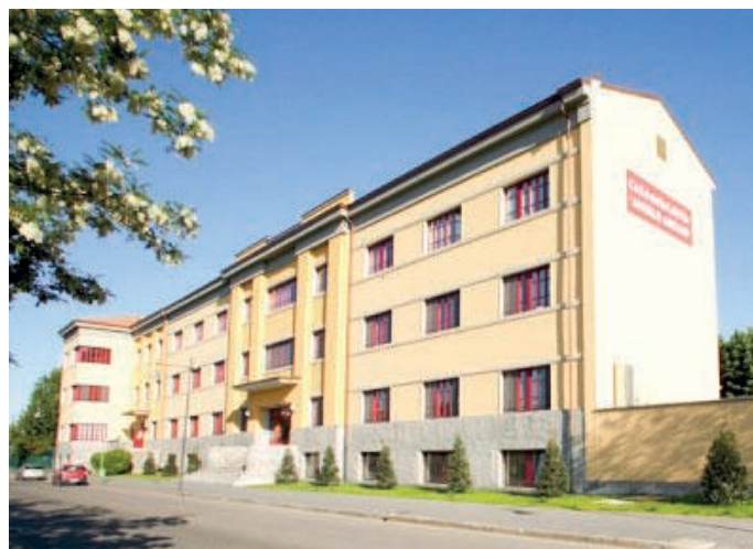
La casa della carità di Milano