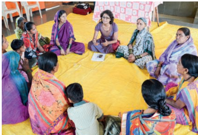
Un incontro di formazione per le donne in India

L'aspettativa media di vita femminile oggi in India è più bassa rispetto a quella di molti altri Paesi, ma ha mostrato un miglioramento graduale nel corso degli anni: in molte famiglie, soprattutto rurali, le ragazze e le donne in genere