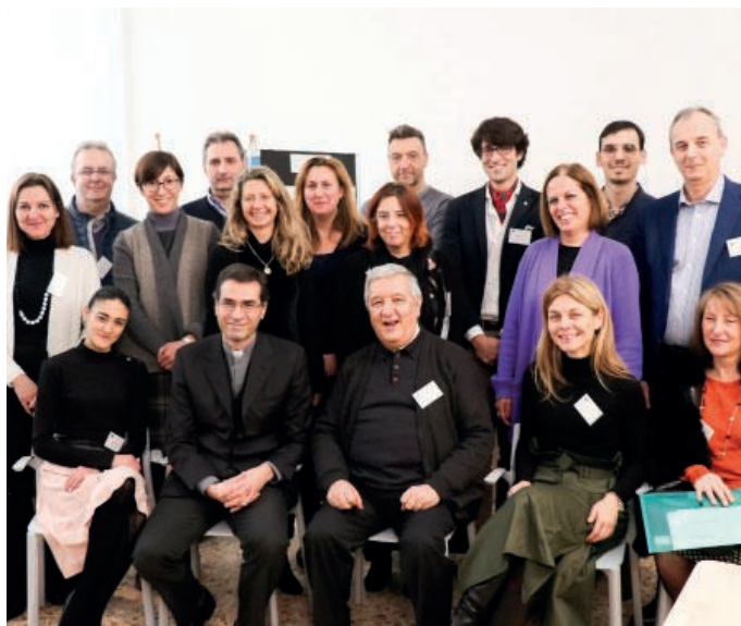
I fondatori dell'associazione 'Amici del Ballerini'