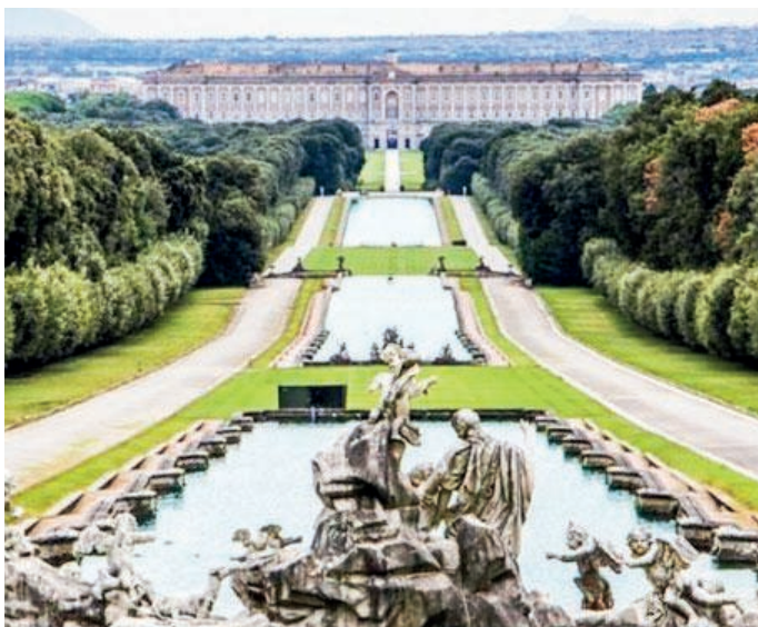
La reggia di Caserta tra le tappe del viaggio

La quota comprensiva di viaggi, hotel, pensione com-